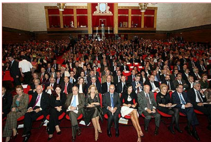
Imagen 9 de 14

Vista general de los más de mil asistentes a los actos de entrega de los Premios Gallegos del Año, en un salón de actos del Auditorio de Galicia completamente abarrotado