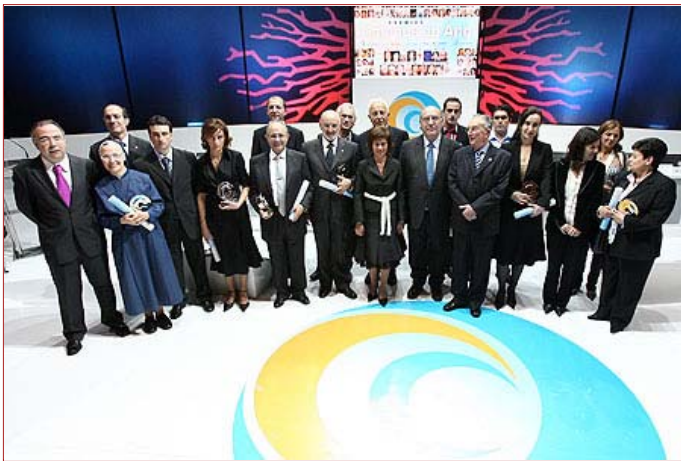
Imagen 1 de 14

Autoridades y galardonados en el transcurso de la tradicional foto de familia que se tomó tras el acto solemne de la entrega de premios en el Auditorio de Galicia