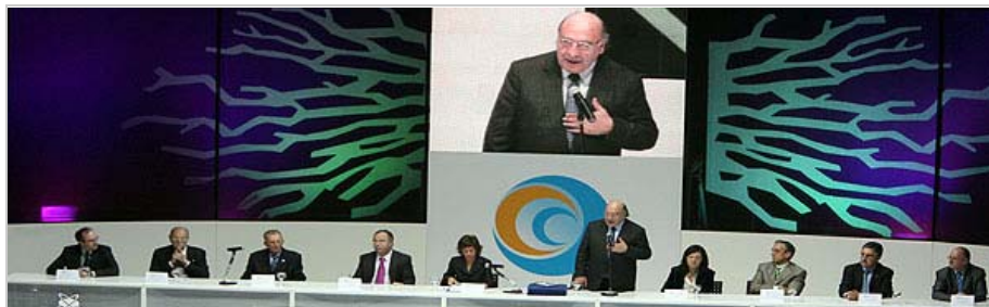
El presidente de la RAG pronuncia su discurso tras recibir el Premio Gallegos del Año

La ministra destacó el papel de la Real Academia de Galicia como “unha das institucións que máis e mellor se incardinan na nosa propia realidade cultural e social” y del resto de premiados, al tiempo que recordaban que estos premios se basan en un compromiso con Galicia “porque veñen a recoñecer o labor calado de moitos galegos e galegas que representan a unha sociedade que aposta polo futuro, respondendo ós retos dun tempo novo” y recordó que esta iniciativa es patrimonio de un pueblo que sabe que “o capital máis valioso son os homes e mulleres”.