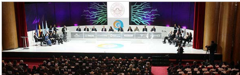
Todos los premiados en la decimoséptima edición de los Gallegos del Año, situados a ambos lados de la mesa presidencial en la gala

Broche de oro de María Nadal España y Galicia se unen en los actos del gran día de EL CORREO Los 'Gallegos del Año', un ejemplo para una tierra de líderes Reconocimiento al Lobelle por lograr el primer título nacional Solidaridad y trabajo firme Xosé Ramón Barreiro: "A RAG seguirá no seu empeño de fidelidade coa patria"