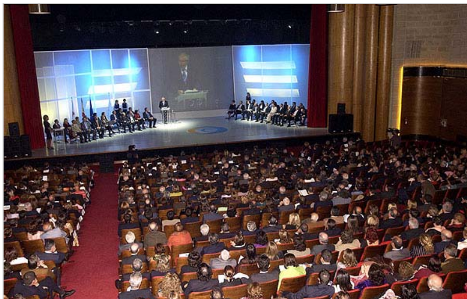
La fotografía recoge un momento de la espectacular gala celebrada el pasado año con la entrega de premios que esta tarde se repite

El Gallego de 2006 premia hoy los cien años de vida de la RAG El nobel Cela inauguró los galardones