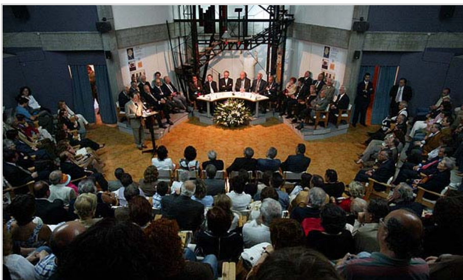
El Museo Carlos Maside de Sada acogió la celebración del Día das Letras de 2006 de la RAG

La Real Academia Galega se sumará hoy a la relación de destacadas personalidades e instituciones premiados con el premio Gallego del Año instituido por el Grupo Correo Gallego en 1990 y lo hace, según reconoció en su día el jurado, en atención a "o seu primeiro centenario de coherente e comprometida vida en defensa e promoción da lingua que nos é común" y también como "unha das institucións que máis e mellor se incardinan na nosa propia realidade cultural e social, dende a súa encomenda de velar por un dos sinais de identidade que nos identifican como pobo".